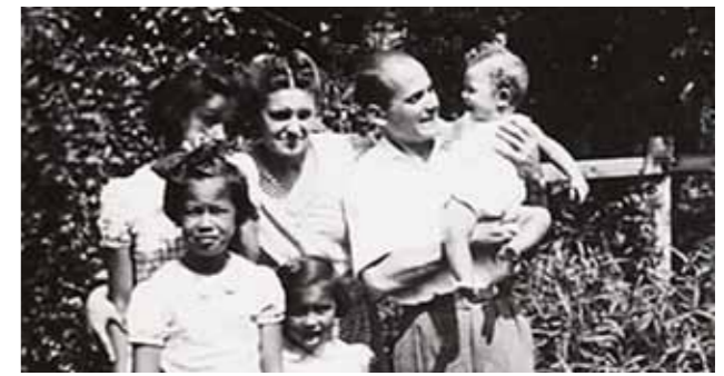
De familie in 1947