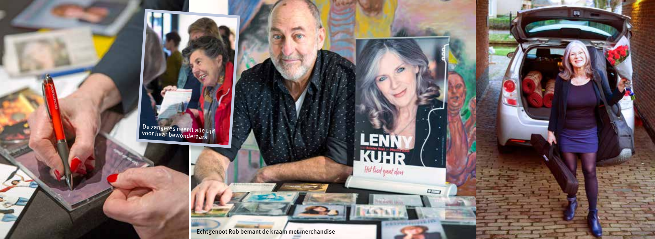
De zangeres neemt alle tijd voor haar bewonderaars