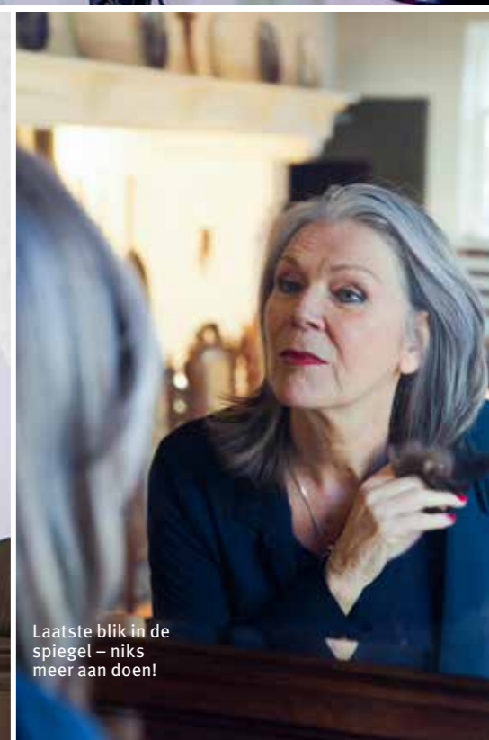
Laatste blik in de spiegel – niks meer aan doen!